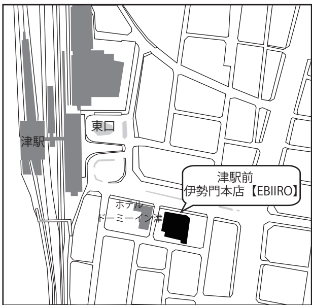
近鉄・JR 津駅東口徒歩一分 (ソシアビル4階はホテルサンルート津になっております)